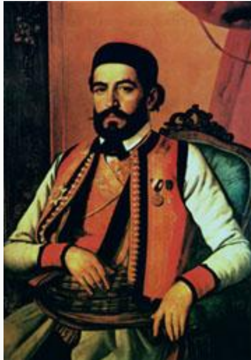
Петар II Петровић Његош