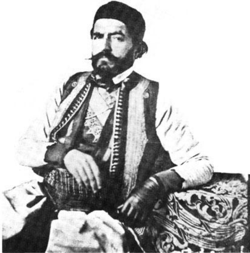
Petar II Petrović — Njegoš

удивленија и велељепоте Твоје, толико сам биједну судбину људску са ужасом разматрао и оплакивао.“ (Из Тестамената )